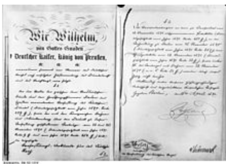
Erste und letzte Seite der Verfassungsurkunde von 1871