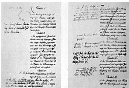
Entwurf für die Norddeutsche Bundesverfassung, 1866