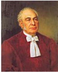
Eduard v. Simson